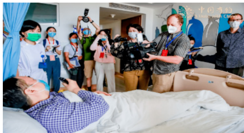
采访团在厦门大学附属第一医院采访日间手术病房。