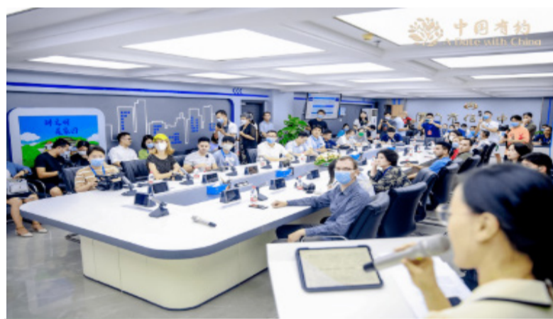
采访团在厦门市信息中心座谈。