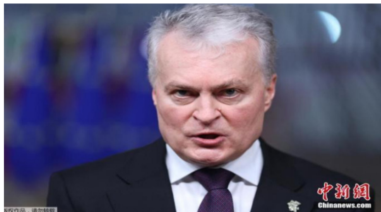
立陶宛总统瑙塞达。