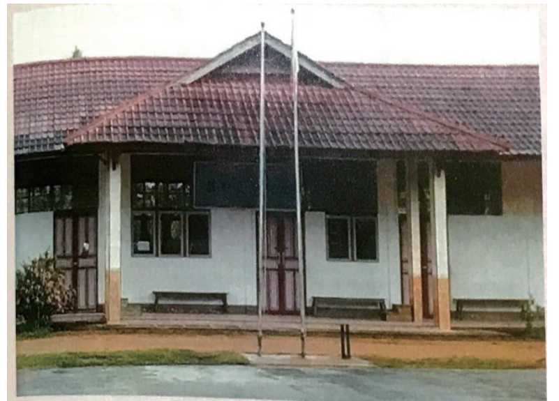
西加百富院大东华文学校

教育通过补习班的形式熊熊燃烧起来，形成燎原大火的奇观。我曾经于2012年参加印尼华文教育工作者观摩学习团去山口洋