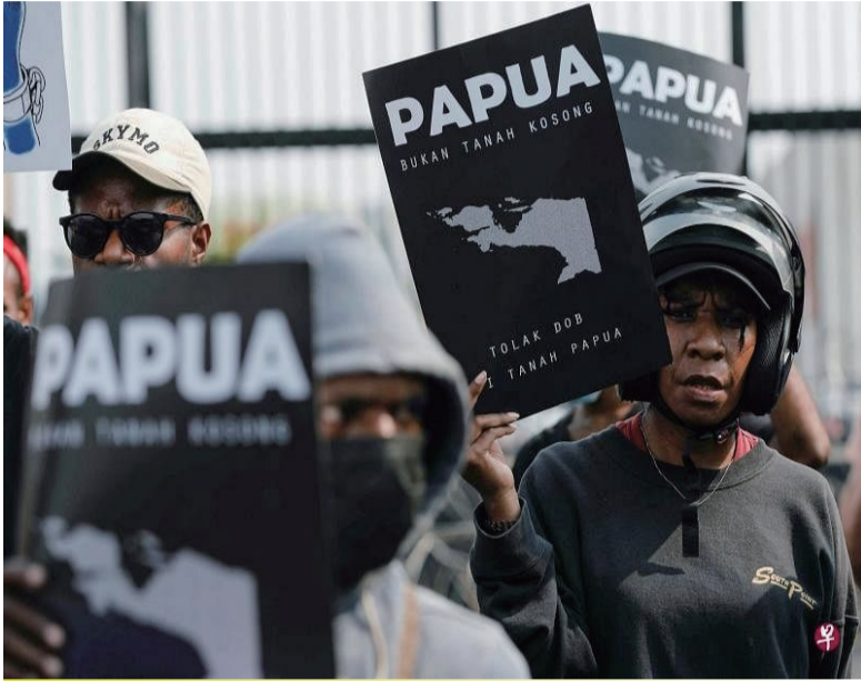
6月30日，示威者在印尼国会外集会，抗议国会通过的在巴布亚增设三个省区的法案

(本报讯) 6月中旬，印尼国会正式通过法案建立三个新省，即巴布亚南省、巴布亚中部省和巴布亚山脉省，使全国从34省变为37省。接着，本周内，国会又建议，要建立“巴布亚西南省”，使巴布亚变为六个省，全印尼成为38省。