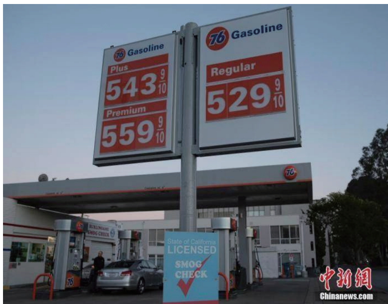
2022年3月, 车主在美国加州圣马特奥县为车辆加油。中新社记者 刘关关 摄

总体而言, 崔守军认为, 短期来看, 俄乌地缘政治冲突推升油价, 但突发性的地缘政治冲突只能带来短期供需失调, 新能源取代化石能源的长远趋势仍未改变。俄乌冲突反而加速了全球能源转型进程, 目前德法等国都在加速向可再生能源转型。(完)