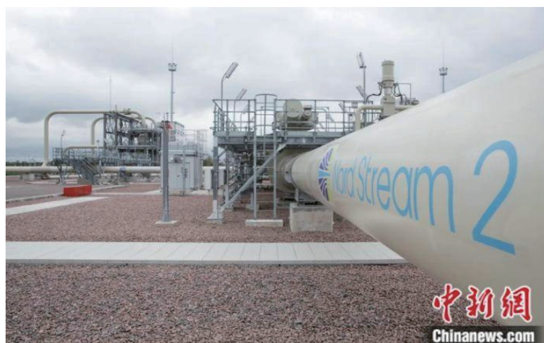
“北溪二号”在俄罗斯境内的管道设施。