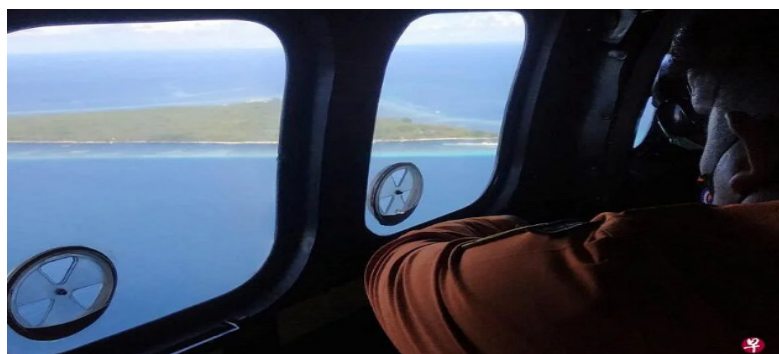
印尼为“千岛之国”，乘坐渡轮是国民出行的主要交通方式之一。船只倾覆沉没事故时有发生。

(早报讯) 印度尼西亚搜救官员星期三(7月6日)说，印尼中巴布亚省米米卡县5日发生一起渡轮倾覆事故，造成11人失