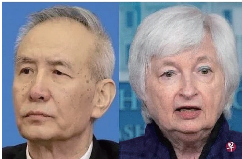
中国副总理刘鹤（左）时隔九个月再次与美国财政部长耶伦（右）举行视频通话。