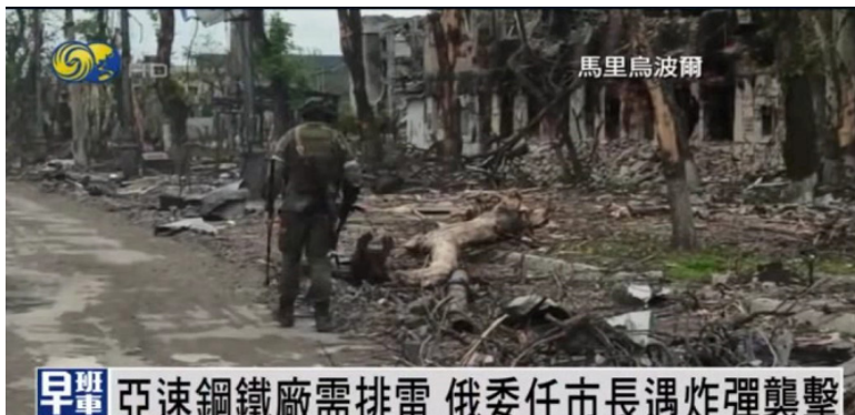
早班 擊落烏軍多架戰機及無人機 俄軍繼續炮擊烏軍據點 炸毀武器軍備 HEADLINES 今日頭條