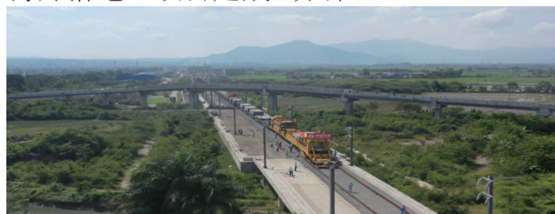
这是7月1日在印度尼西亚万隆拍摄的雅万高铁雅万高铁正线有砟轨道铺设施工现场（无人机照片）。