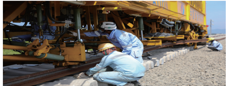
7月1日，在印度尼西亚万隆，工人在雅万高铁正线有砟轨道铺设施工现场作业。

公里，无砟铺轨166.6公里，均采用中国生产的50米钢轨。国产钢轨运至雅万高铁铺轨基地后，采用全套国产装备和先进的脉动闪光焊工艺，将50