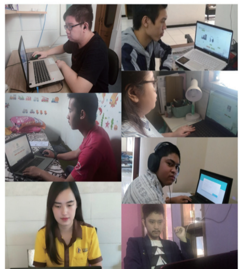
2020年5月15日首次参加居家网考的部分考生