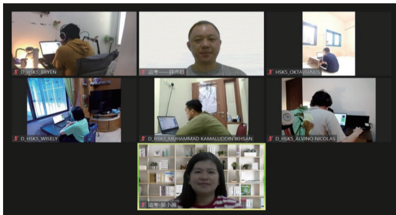
北干考务人员及考生