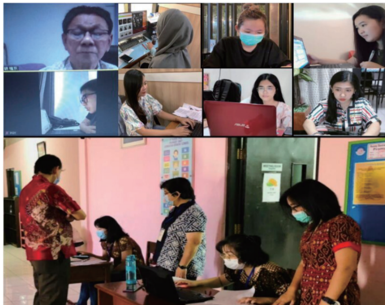
占碑、梭罗等分考点考务人员