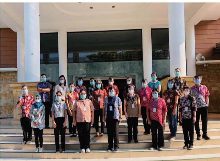
巴厘岛分考点考务人员合影