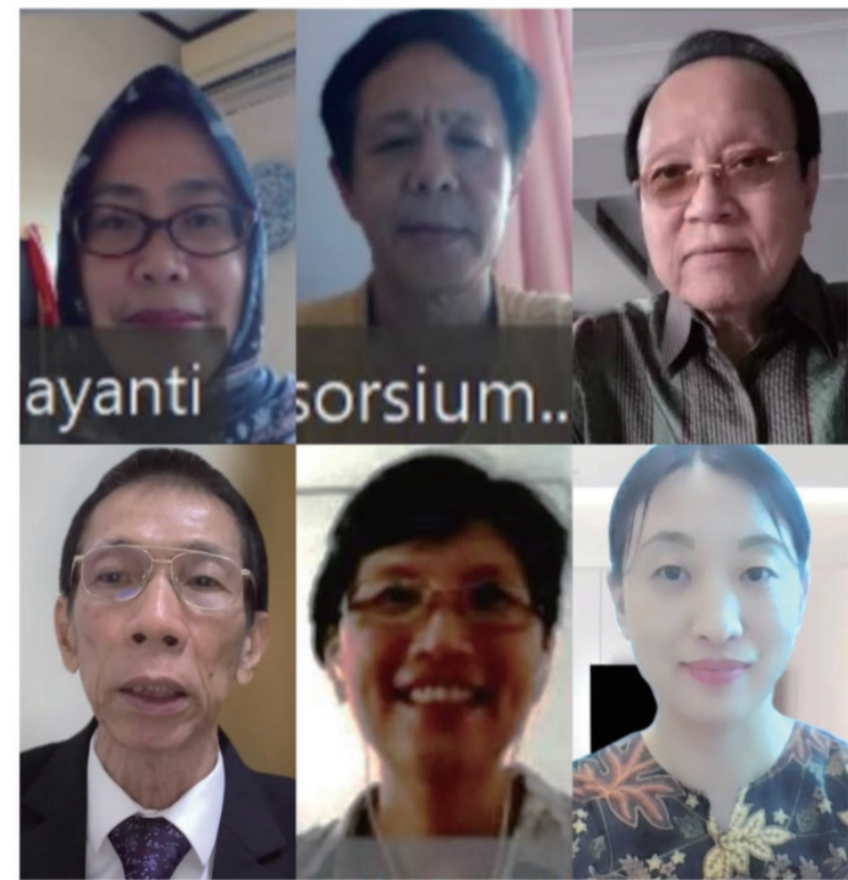
印尼教育部华教统筹处、雅协领导及总监考