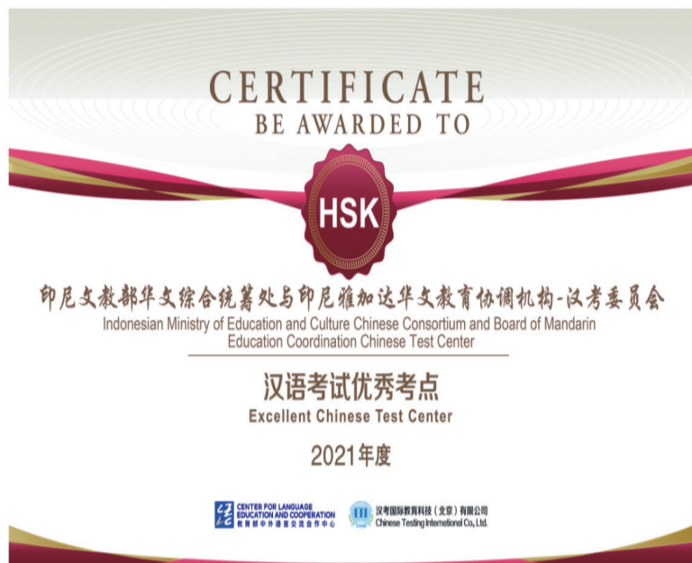
2021年度统筹处和雅协 被评为优秀考点