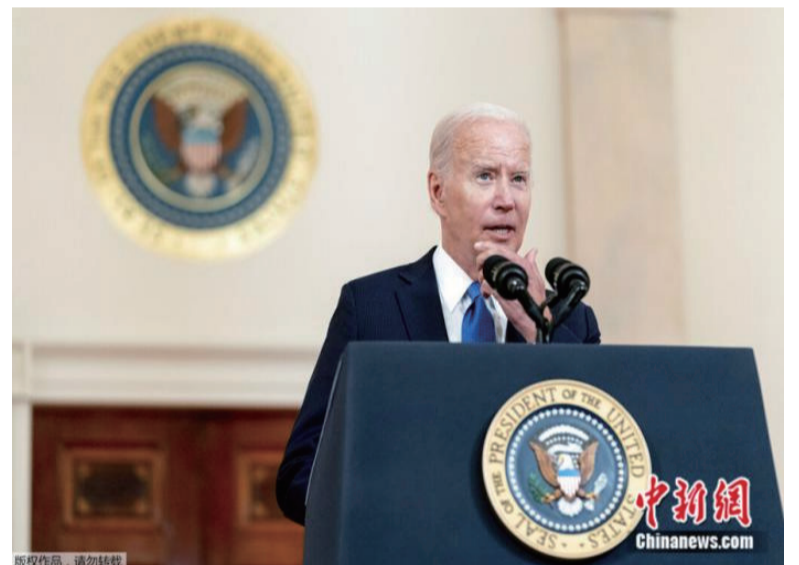
当地时间6月24日，美国总统拜登在白宫发表讲话。