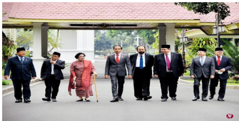
印尼总统佐科（左四）上周三宣布改组内阁前，先与美加华蒂（左三）等执政联盟的各政党领导人共进午餐，意图展示团结一致。有传言指各党在午餐会上达成共识要防止非政党候选人或“政界局外人”参与总统选举。

有传言说美加华蒂与佐科之间，已因总统候选人产生嫌隙。佐科在“建国五原则”纪念日主办的一项活动，美加华蒂没有出席。建国五原则是美加华蒂父亲前总统苏卡诺在1945年《独立宣言》中所提出。