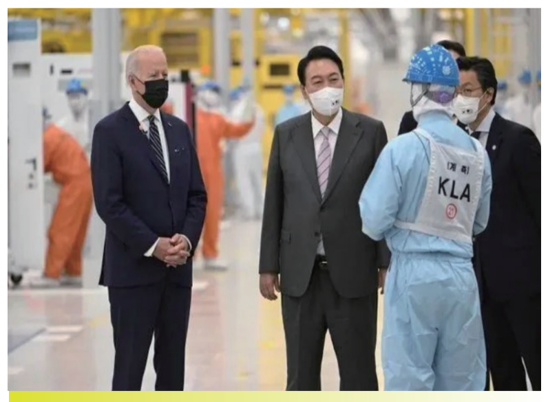
韩国作为初始成员国加入印太经济架构。图为拜登和尹锡悦一起参访三星集团。