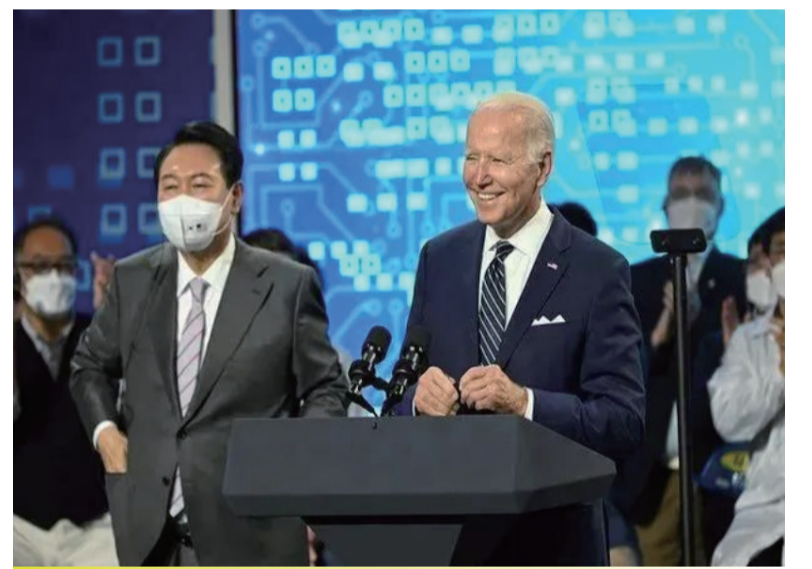
5月美国总统拜登展开他上任以来的首次亚洲之行，于5月20日至24日访问韩国和日本。拜登宣布成立由美国主导的“印太经济框架(IPEF)”