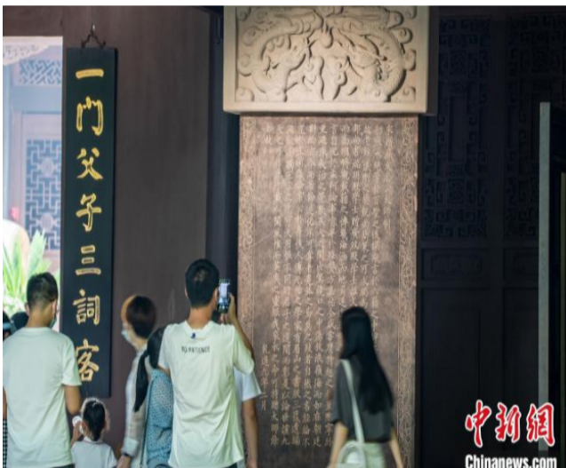
游客在三苏祠里拍照。