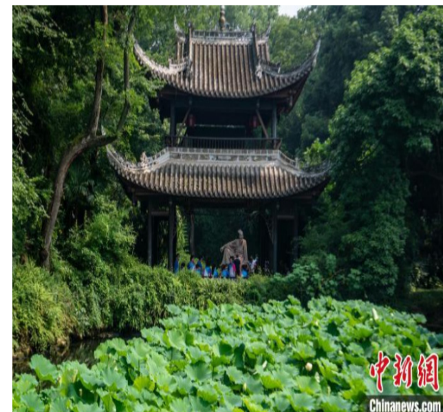
三苏祠披风榭与东坡盘陀坐像。