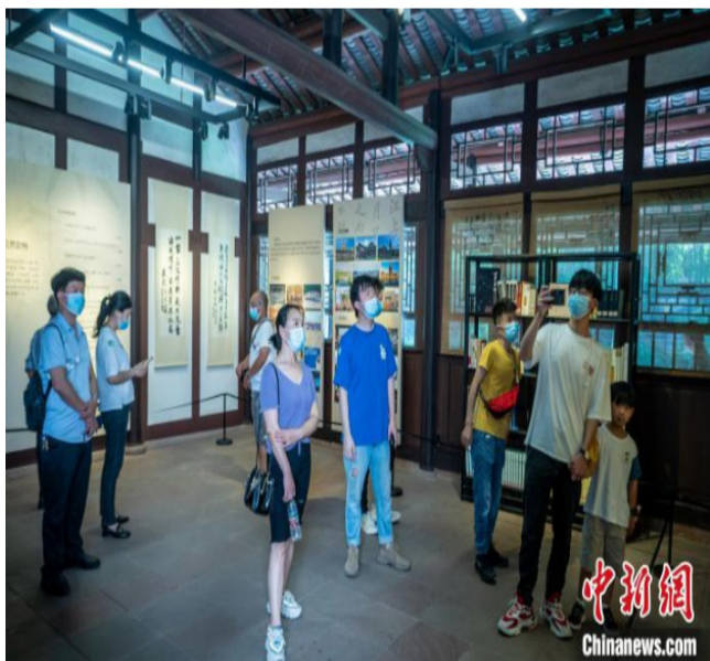
游客参观三苏祠。