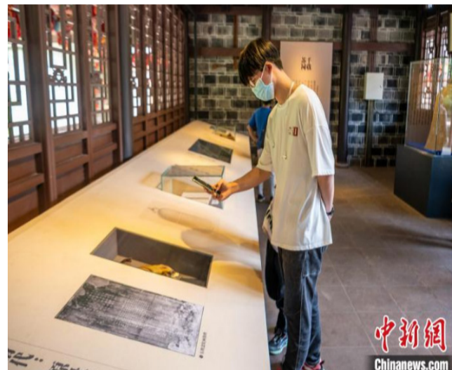
游客用手机拍照留念。