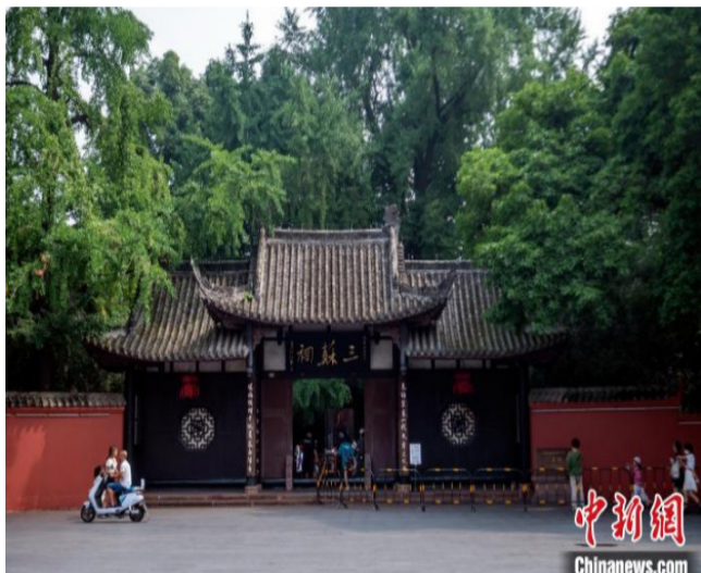
眉山三苏祠大门。