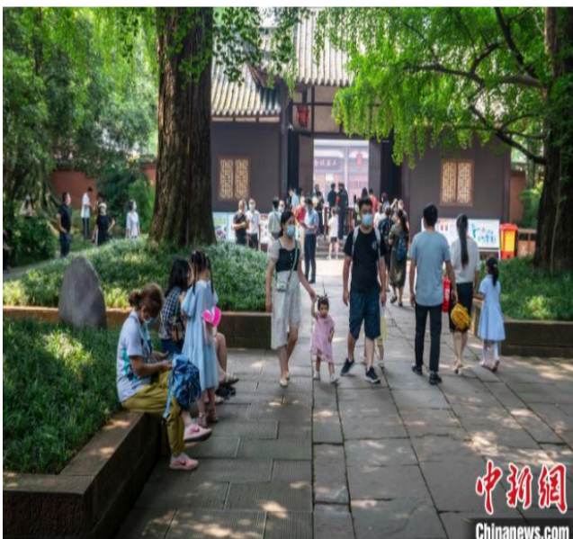
三苏祠里的游客们。