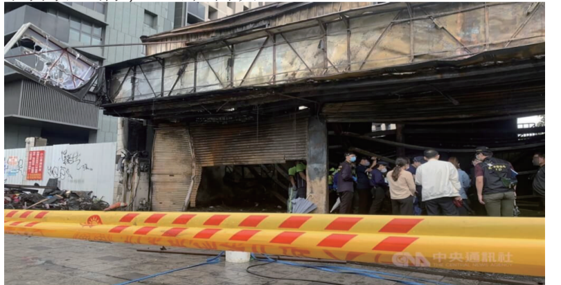
新竹市东大路一间轮胎行15日深夜发生火灾，导致屋内4大人、4小孩葬身火窟。