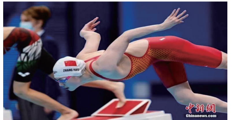
资料图：张雨霏在比赛中。中新社记者 富田 摄