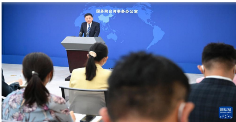
6月15日，国台办发言人马晓光回答记者提问。