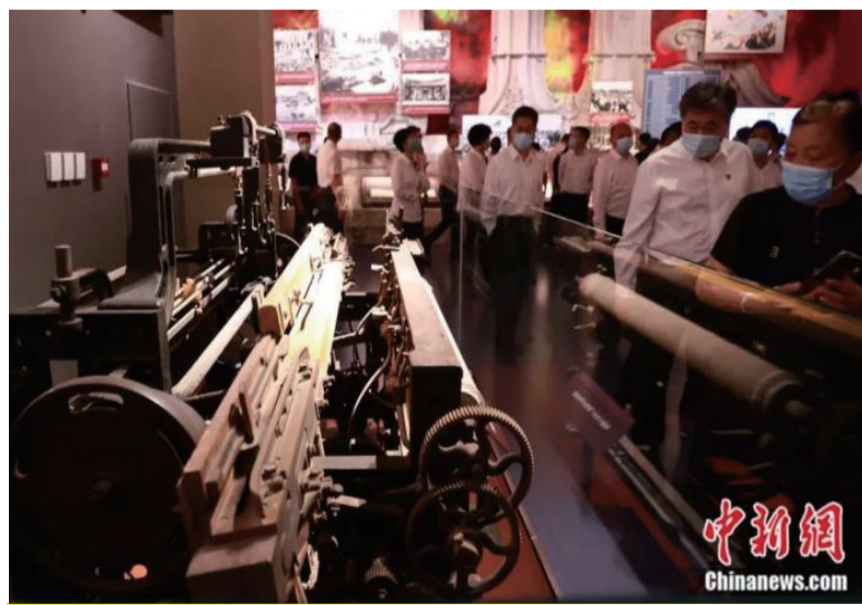
观众在位于北京的中国共产党历史展览馆上观看南通大生纱厂使用的亨利织机。