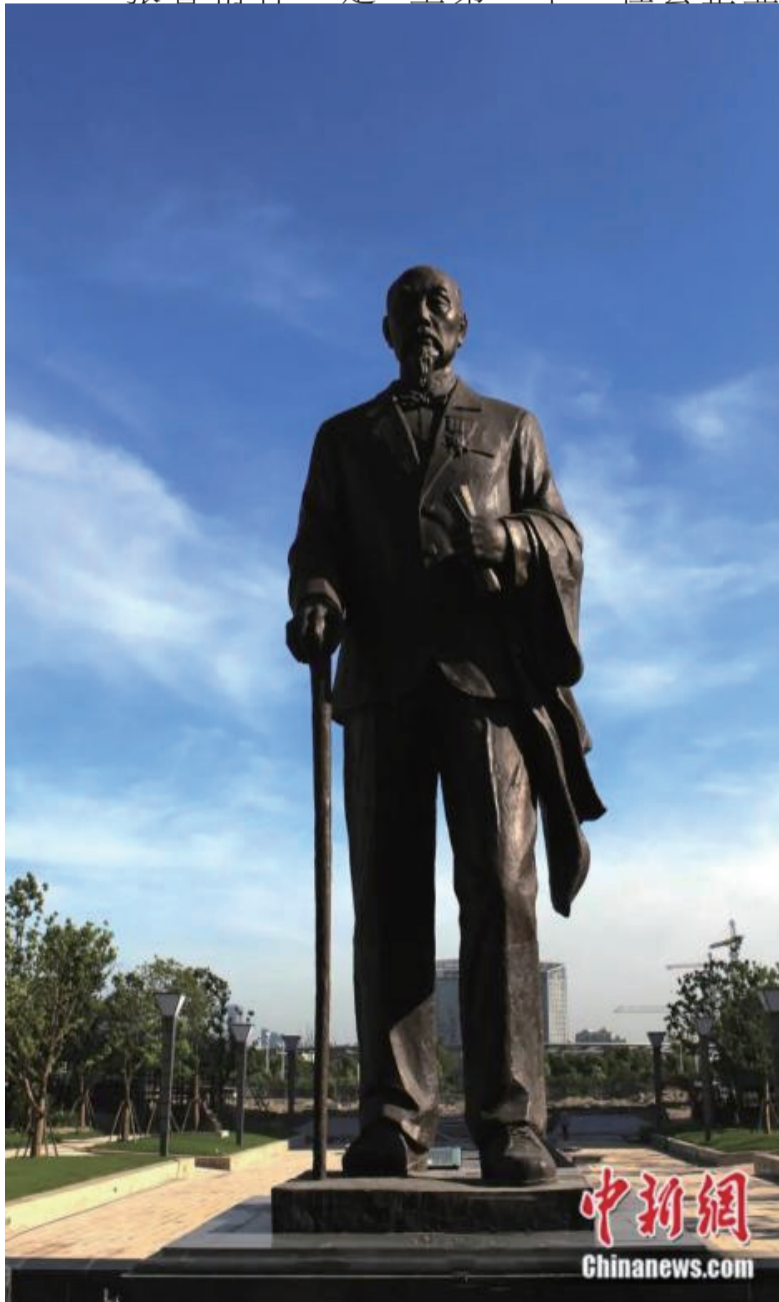
位于江苏南通中央公园的张謇像（2012年摄）。