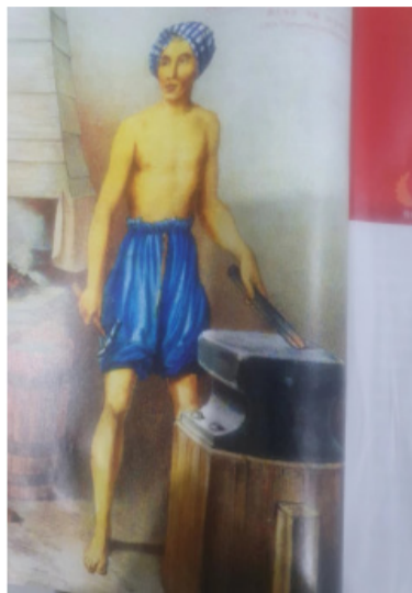
19世纪印尼雅加达的华人铁匠

陈达生(Tan Ta Sen)(2009)在对郑和(或称三宝/三保 Sam Po)的生活背景及其在东南亚伊斯兰教传播中所扮演角色的研究指出,这期间也发生了科技转移现象。