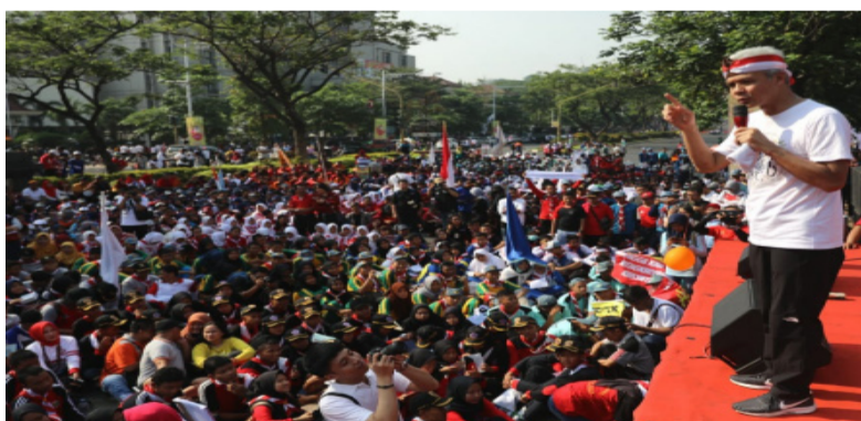
中爪哇省省长甘贾尔 ● 普拉诺沃 (Ganjar Pranowo) 在参加集会的学生面前讲话，以纪念在中爪哇省三宝壟举行的国际反腐败日。

Hanta说：“模拟发现，没有任何一对强者能够获得超过 50% 选票的压倒性胜利，并在一轮内结束总统竞选。”意即可能要要进行二轮选举。