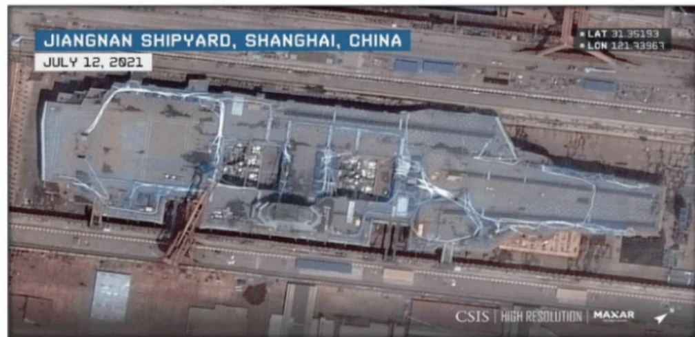
Figure 11. Type 003 Aircraft Carrier Under Construction