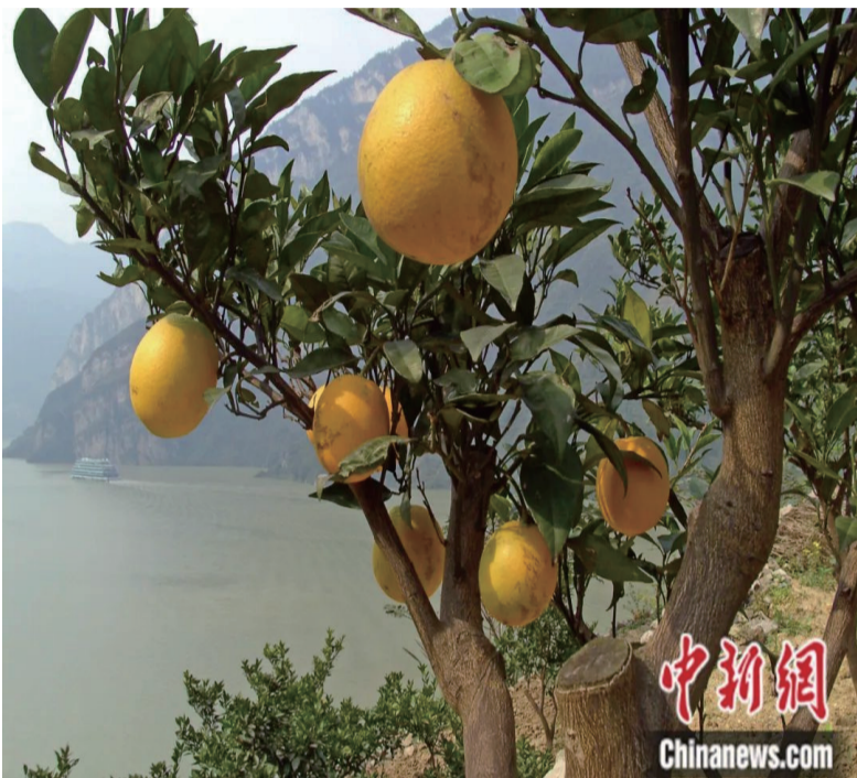
屈原故里湖北省秭归县柑橘丰收。

拟人手法，塑造了橘树坚守节操的美好形象。“后皇嘉树，橘徕服兮。受命不迁，生南国兮。深固难徙，更壹志兮。”“独立不迁，岂不可喜兮？深固难徙，廓其无求兮。苏世独立，横而不流兮。”橘树的形象正是屈原的自我写照和自我激励，这是屈原精神的生发。