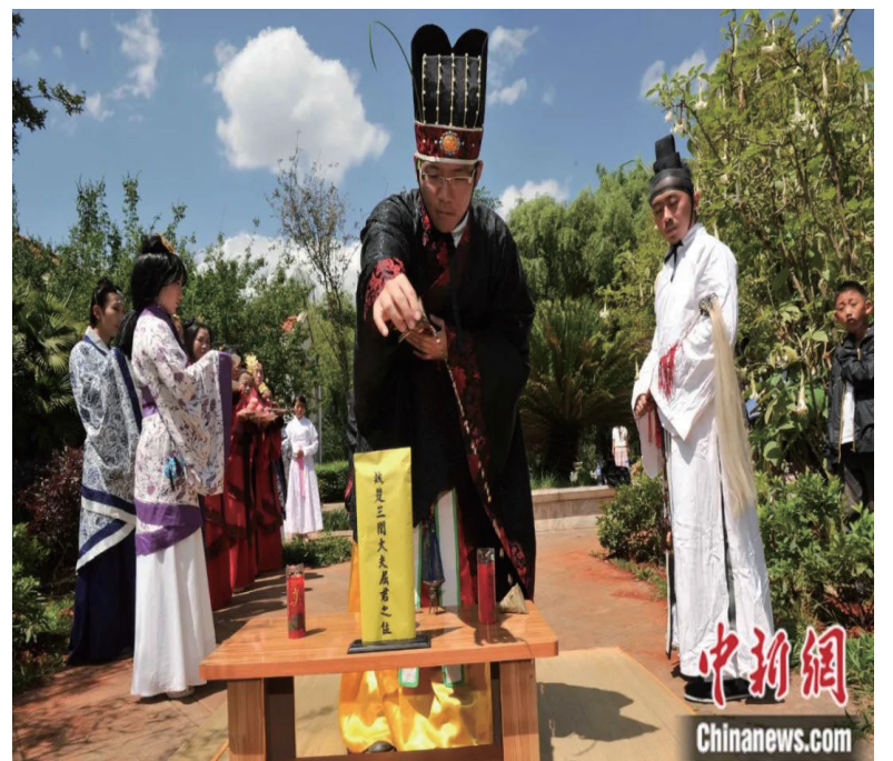
昆明市民祭祀屈原。

《尚书》中说：“民惟邦本，本固邦宁。”民本思想是中国三代以来，先贤们治国理政的共识。屈原也接受了这一先进思想，并将其作为自己美政思想的重要内容。“长太息以掩涕兮，哀民生之