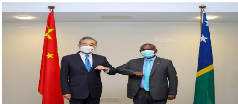
中国外长王毅（左）在5月26日于所罗门群岛首都霍尼亚拉与所罗门群岛外长马内莱举行正式会谈。