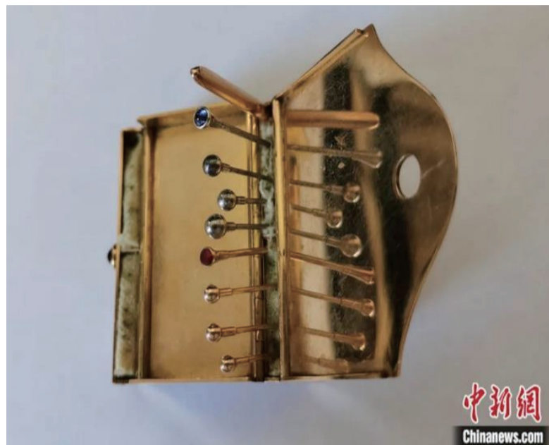
20世纪初苏烈自制的中医针灸金针套组。中新社发 尧雪洲 摄

(James Reston)访问中国期间突患急性阑尾炎，在术后接受了针灸治疗。回国后，詹姆斯将他的经历和中医的神奇疗效写成稿件发表在《纽约时报》头版，由此在欧美国家掀起了一场“针灸热”，也带动更多国家研究和学习中医药。