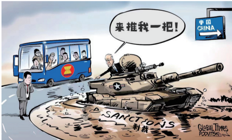
▲ 美国深陷乌克兰危机带来的制裁泥沼，却仍不忘拉拢东盟国家打压遏制中国。 (漫画 | Vitaly Podvitski)

金平认为，任何排除中国的地区性或全球性贸易框架都很难有效运作，因为中国是全球供应链的最重要组成，也是全球增长的重要引擎。(经济日报记者张保)