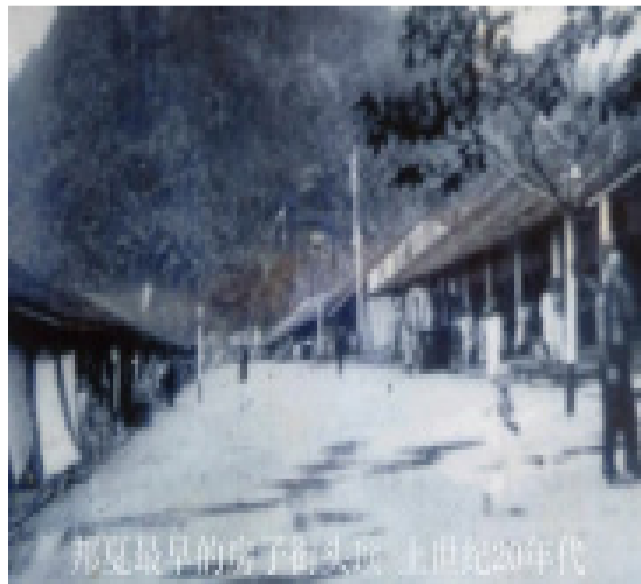
20世纪20年代，邦夏市政街区由政府规划，先行施工，而后又推行免征税60年政策，30年代，许多华人沿街建店屋。