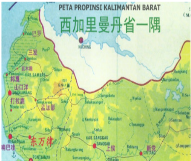
据留在当地的校友说，1965年中秋夜，邦夏又发生火灾，几乎将第一次没烧到的街区烧光，环球戏院也烧掉，只剩下圣堂路南部及天主堂幸免。

为了同侨的孤寡老人，同乡会置地建房，办孤老院(建中学校舍的原地)。还有体力的可以种点菜，无体力的白天到镇上乞讨，不致没人关心。