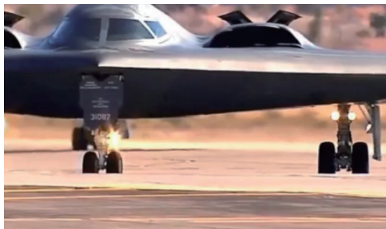
美国至少有66架能携带核弹头的战略轰炸机