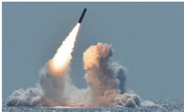
资料图：美国海军试射一枚新型海基核导弹。