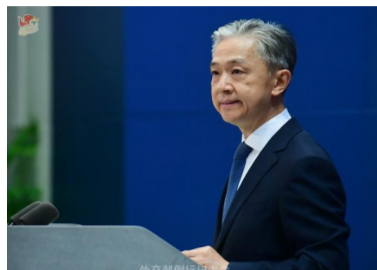
外交部发言人汪文斌。

中新社北京5月23日电 (谢雁冰 邢翀)针对美方正式宣布启动“印太经济框架”，中国外交部发言人汪文斌23日在例行记者会上表示，亚太应该成为和平发展的高地，而不是地缘政治的决斗场，企图把亚太阵营化、北约化、冷战化的各种阴谋都不可能得逞。