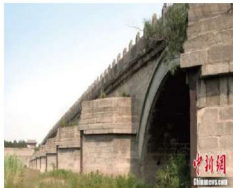
“斩龙剑”及石桥拱券上的吸水兽。