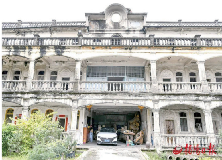
△ 兰香楼局部。

林毓瑞非常珍惜“出门一家亲”的异国乡情乡谊，凡是家乡人过番来投靠“兰香”的，都得到他们的热情关照，极力相助。“兰香”公司接待乡亲的方式有：先安置乡亲住宿，然后指导乡亲“换水土”；每人发给大洋3~5元寄“回头批”，向家乡亲人报平安；有意愿留在公司工作的乡亲，先从勤