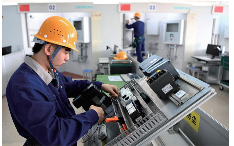
一项调查显示，中国83%的制造企业表示有不同程度的蓝领用工荒。（新华社）