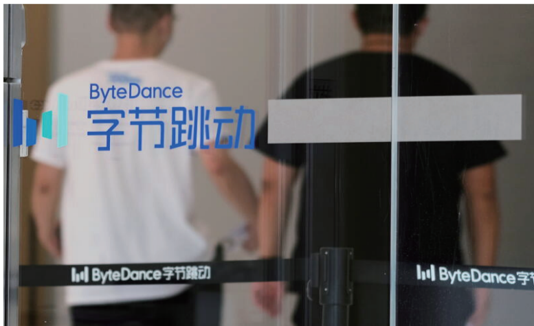
字节跳动等各大互联网企业今年开始出现大规模裁员。

国务院上月27日的常务会议再一次强调，要做好就业服务和兜底保障，包括健全高校毕业生就业网上签约系统；对延迟离校毕业生，延长报到入职、档案转递、落户办理时限