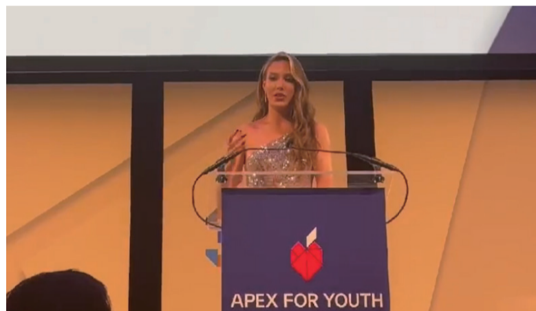
谷爱凌纽约领取新生代领军人物奖