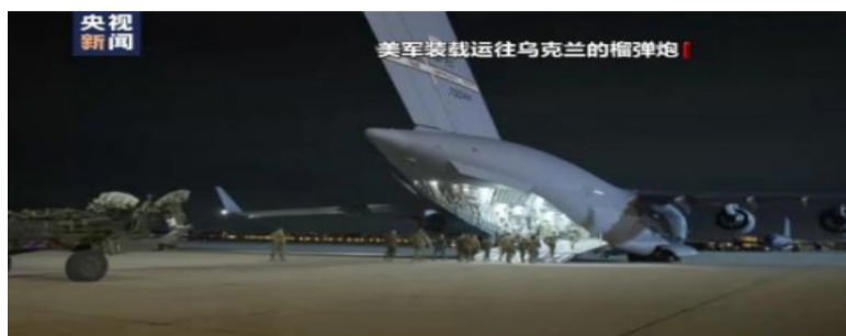
美媒：西方火炮或将使战斗变得血腥

有网友表示，“美国和欧盟向乌克兰运送更多重型武器的政策没有任何意义，只会延长乌克兰和俄罗斯人民的痛苦。” (完)