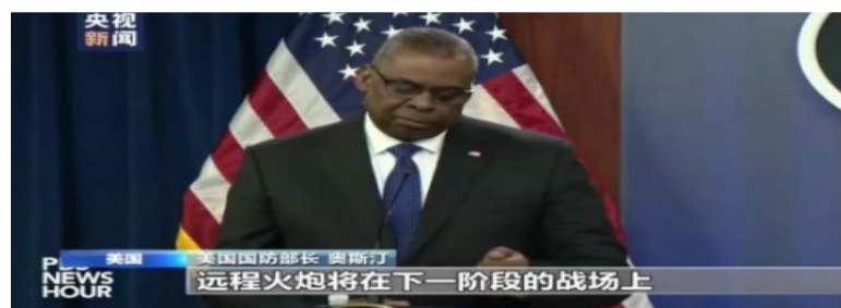
美国国防部长 奥斯汀：远程火炮将在下一阶段的战场上产生“决定性”影响。