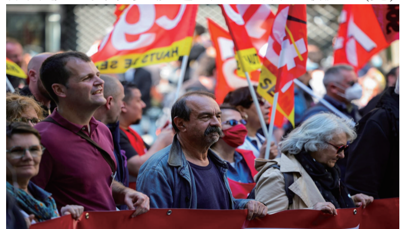
当地时间2022年5月1日，法国巴黎，当地民众举行劳动节游行。

人，在4月总统选举首轮投票中的得票数排名第三，仅次于赢得选举成功连任的总统马克龙和极右翼政党“国民联盟”候选人玛丽娜·勒庞。（完）