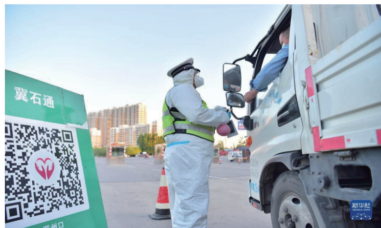
5月1日，在石家庄石黄高速晋州站口，交警对出站车辆进行检查。