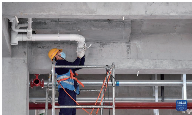
5月1日，中建二局陕西分公司的工人在陕西国际商贸学院项目工地施工。