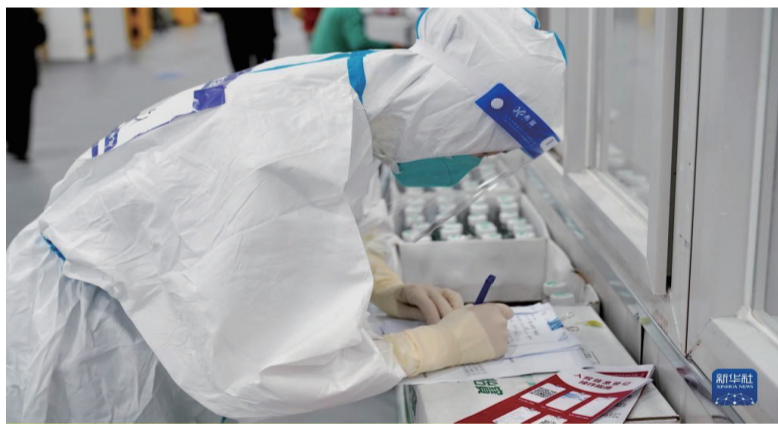
4月30日，上海临港方舱医院的医护人员在整理感染者信息。

美好生活靠劳动创造，让每一份坚守都写下值得。奋力追逐梦想，再平凡的岗位也会出彩，再平凡的人生也会发光。