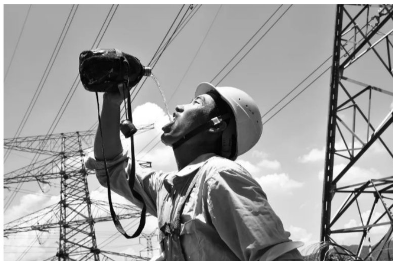
1999年4月，深圳福田区一工地上的建设者在酷热天气下补充水分。

2020年10月14日，习近平总书记在深圳经济特区建立40周年庆祝大会上指出：“深圳是改革开放后党和人民一手缔造的崭新城市，是中国特色社会主义在一张白纸上的精彩演绎。深圳广大干部群众披荆斩棘、埋头苦干，用40年时间走过了国外一些国际化大都市上百年走完的历程。这是中国人民创造的世界发展史上的一个奇迹。”