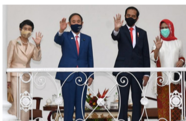
佐科维与夫人会见日本首相岸田文雄与夫人

（本报讯）印尼总统佐科维强调，在俄罗斯和乌克兰之间的战争造成分裂威胁的情况下，我国希望团结20国集团的成员。