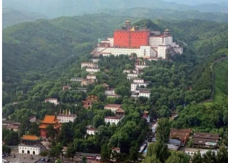
▲避暑山庄的建筑样式体现了“锦绣河山之缩影，民族团结之象征”