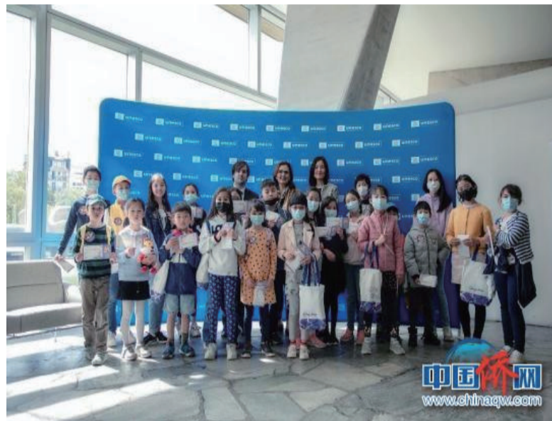
华裔青年在联合国中文日探访联合国教科文组织巴黎总部