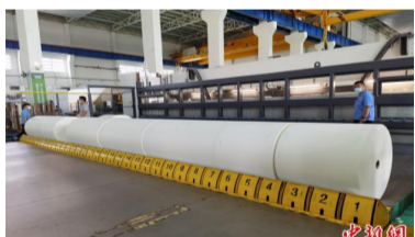
北海太阳纸业文化纸生产车间。

4月26日，距离东盟国家越南200余公里，广西北海市铁山港临海工业区，太阳纸业有限公司年产55万吨文化纸生产车间一片繁忙。自2020年3月动工到2021年9月出纸，这条生产线耗时18个月，创造了全球特大型纸机最快调试纪录、最快开机纪录、最快出产一等品纪录。