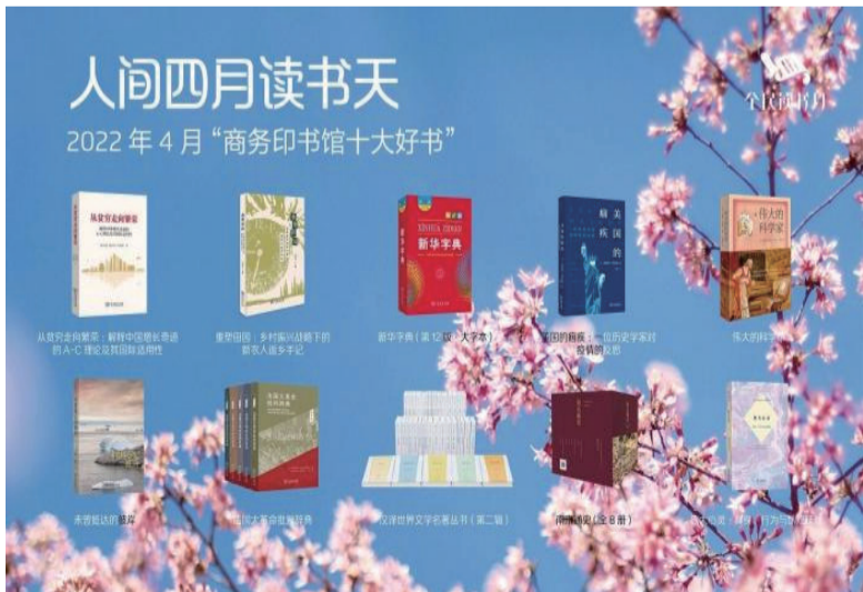
商务印书馆4月十大好书的书封

据悉，在4·23“世界读书日”来临之际，商务印书馆推出“全民读书月”系列活动，自4月18日至4月30日每天都有直播，从英语学习类、传统文化类、到文学名著类专场直播，让更多的读者与好书相遇。(完)