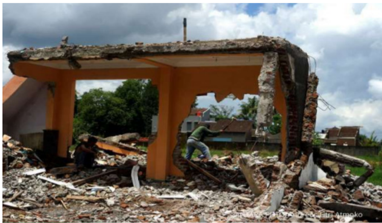
工人们拆除了一座将用于日惹Bawen收费公路的房子，该公路位于 Jambangan 地区，Margomulyo, Seyegan。