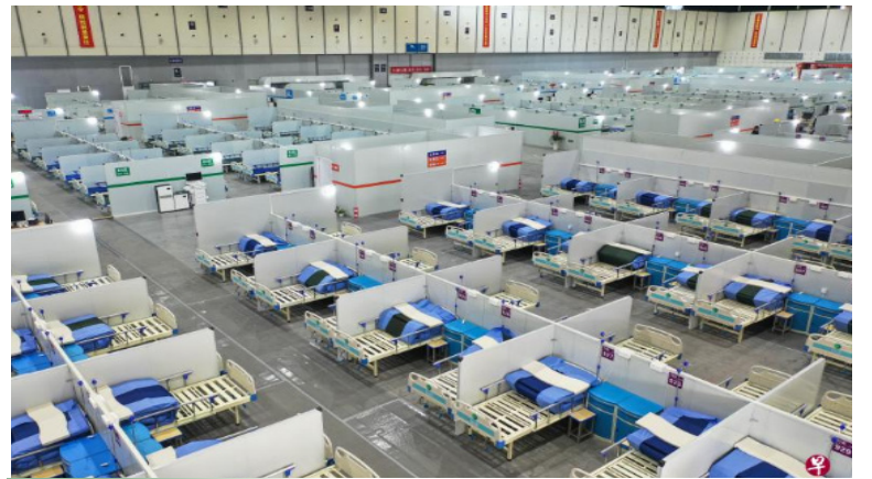
中国卫健委主任马晓伟说，隔离收治能力要再增强，目前最突出的是隔离房源和方舱医院问题。图为南京国际博览中心方舱医院。