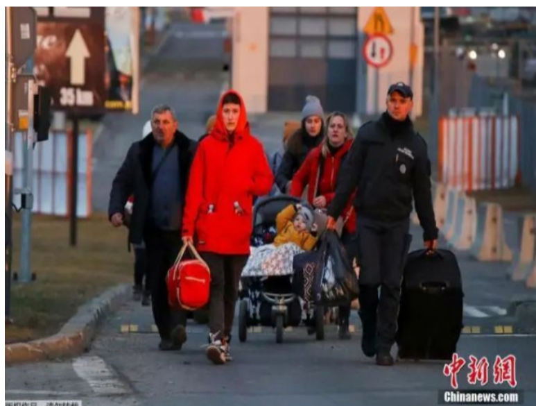
当地时间2月26日，乌克兰与波兰接壤的梅迪卡边境口岸，乌克兰民众排队等待进入波兰境内。