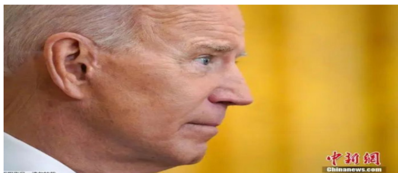
资料图：美国总统拜登

当地时间13日，美国政府宣布向乌克兰提供价值8亿美元的额外军事援助，对乌援助额已超过20亿美元。