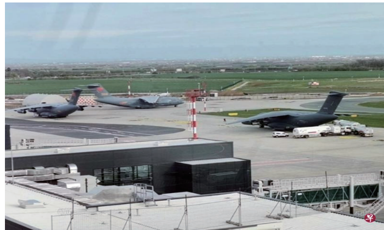
中国空军的六架运-20运输机上周六降落在塞尔维亚首都贝尔格莱德的民用机场，网上出现目击者上载的现场照片。