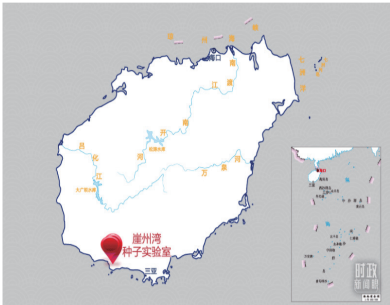
△4月10日考察点示意图