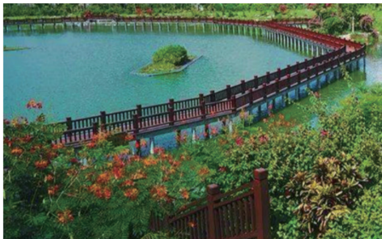
△三亚吉阳区博后村，村民将“小康不小康 关键看老乡”刻在了村口的石头上。(资料图)

4月10日，习近平总书记来到海南三亚，开启今年第三次国内考察。党的十八大以来，总书记三次赴海南考察，每次都是在万物勃发的4月，每次都踏访了海南岛最南端的三亚。这次在三亚，习近平重点考察了两家科研单位，关注了两件具有战略意义的大事。