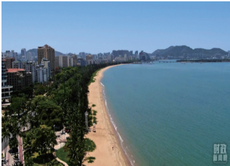
△2022年4月，海南三亚。