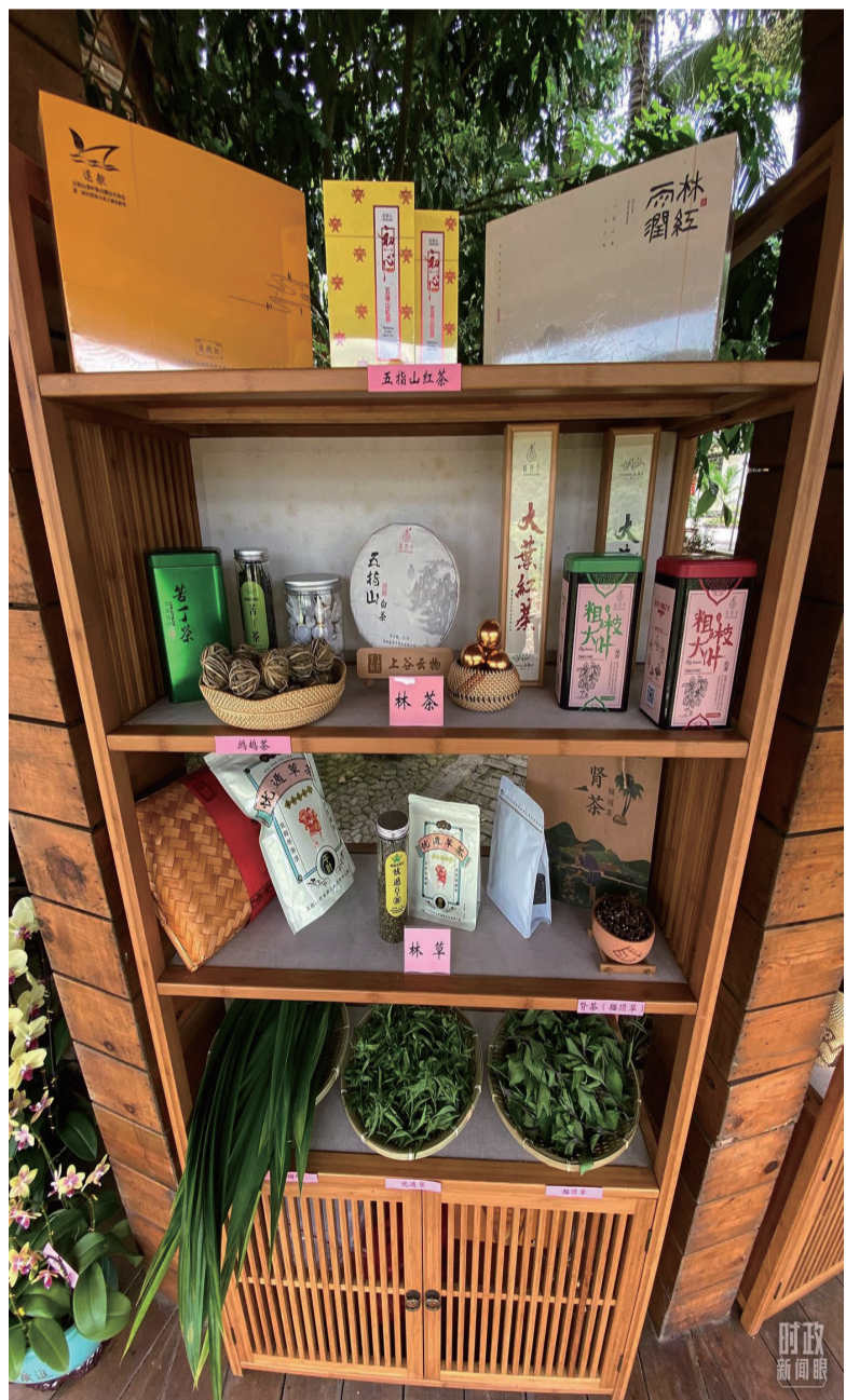
△水满乡毛纳村的特色农产品。