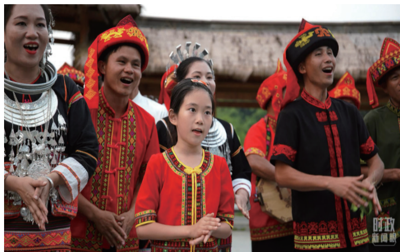
△身着民族服饰的当地村民在毛纳村广场上唱起民歌。