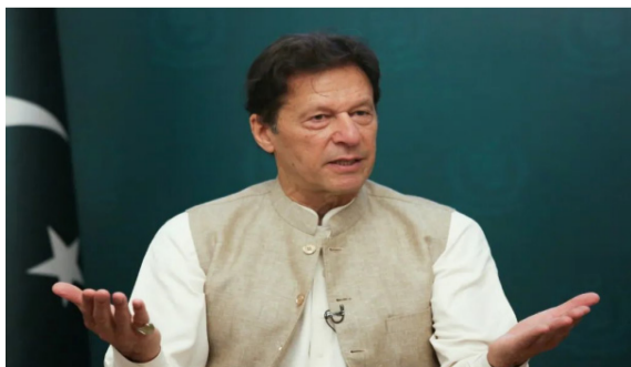
被罢免的巴基斯坦总理伊姆兰·汗