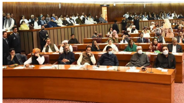
巴基斯坦国民议会