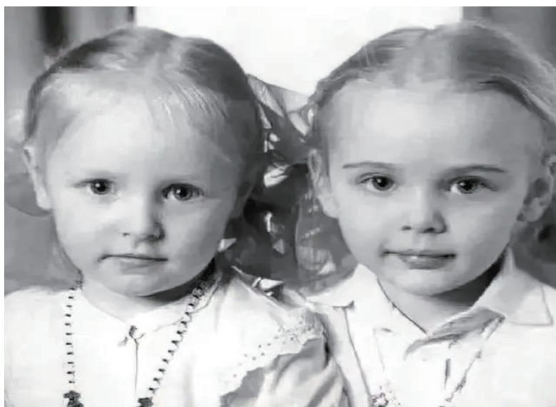
俄罗斯总统普京大女儿玛丽亚·沃隆佐娃（右）和小女儿卡特琳娜·季霍诺娃（左）儿时照片。